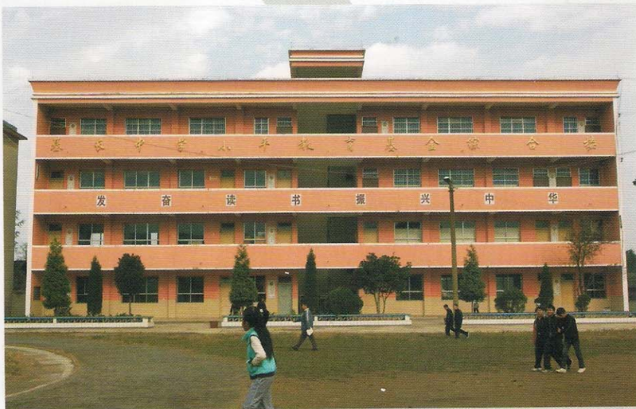
独山县基长镇中学新教学楼