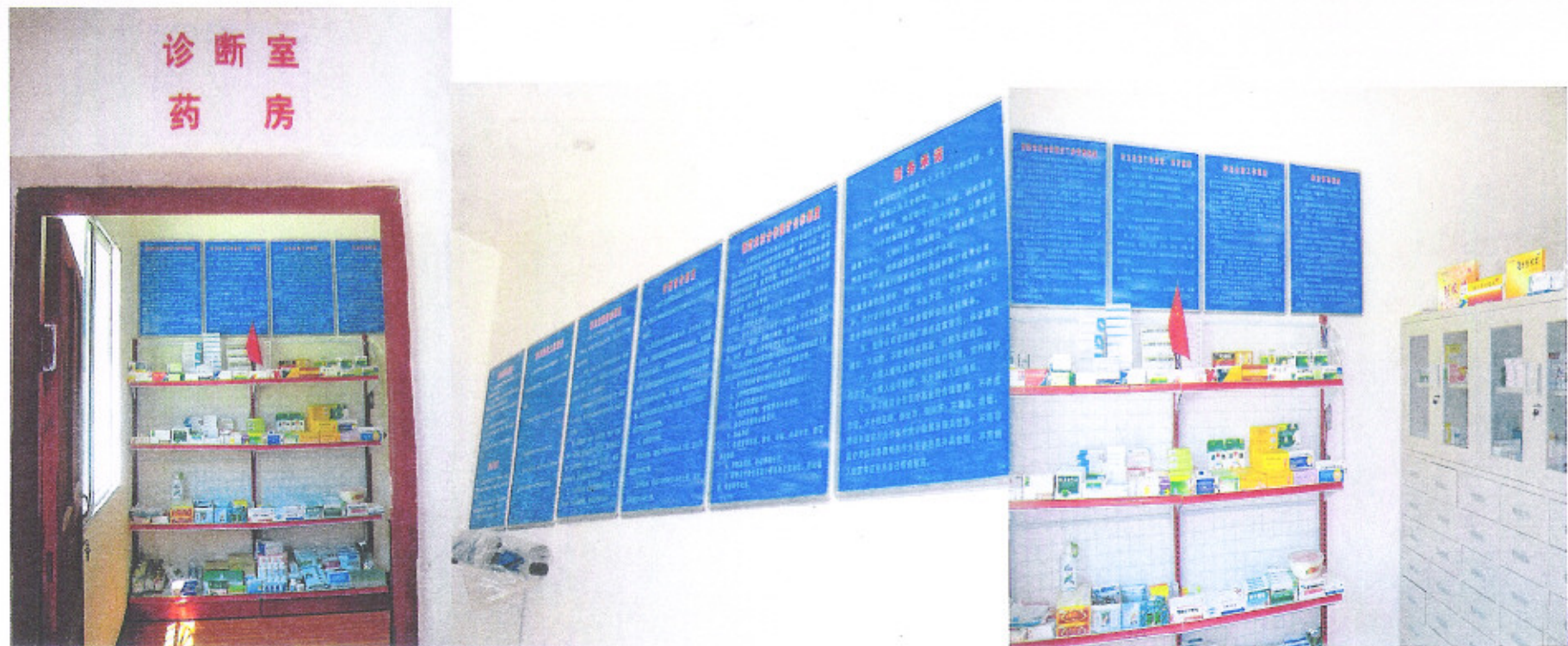
新建成的团泽镇卜台村卫生室图片