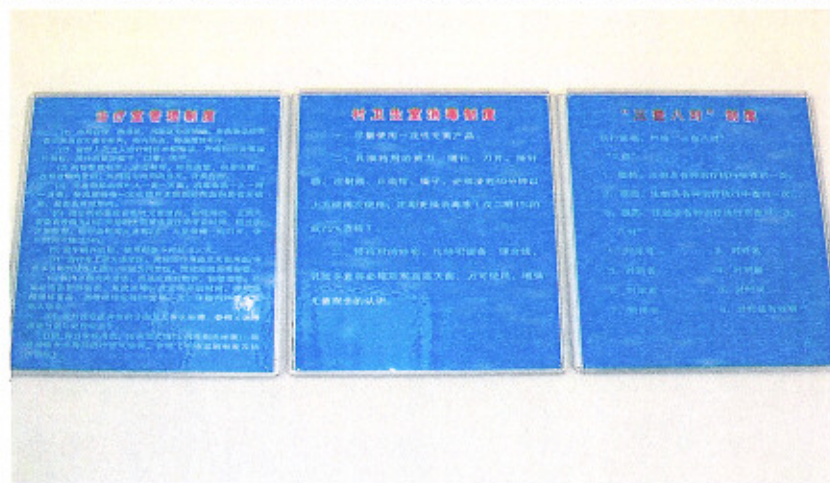
新建成的团泽镇卜台村卫生室图片