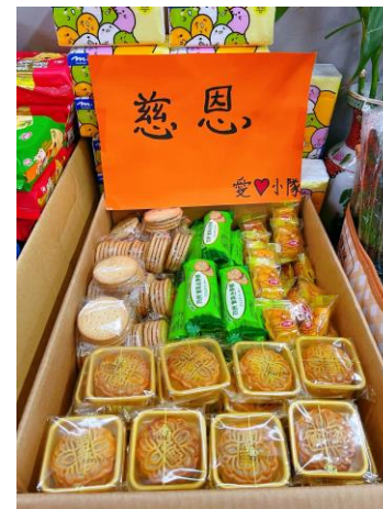
义工们探访老人院