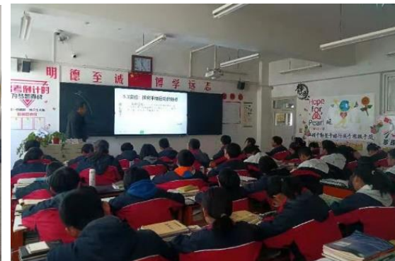
会宁县第三中学的智能黑板