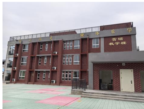
河南省援建的教学楼