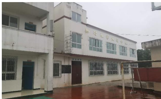
贵州赤水市援建的学生宿舍楼