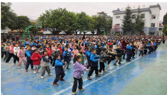
义工们考察贵州省学校情况