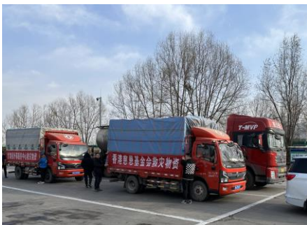
2023年甘肃大地震送上救援物资