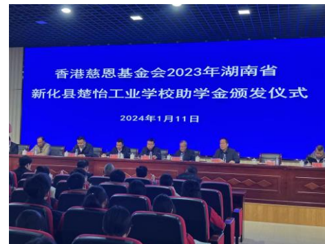
贵州省及湖南省助学金发放仪式