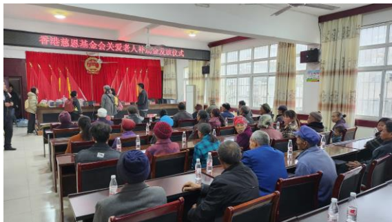
贵州省关爱老人发放生活津贴