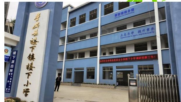
贵州兴义市综合楼竣工