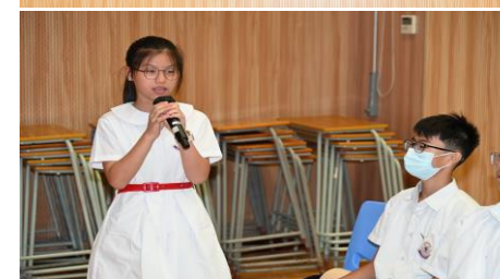
第二届慈恩学业进步奖颁奖典礼