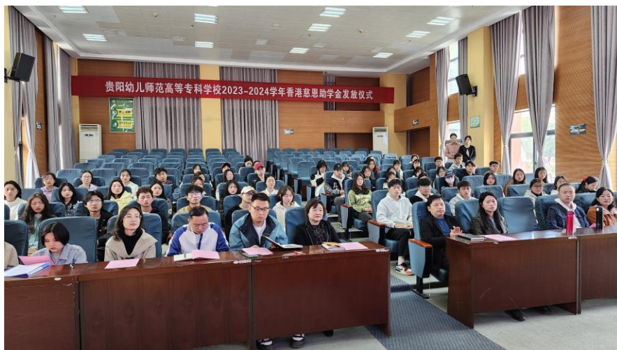
贵阳幼儿师范助学金发放仪式