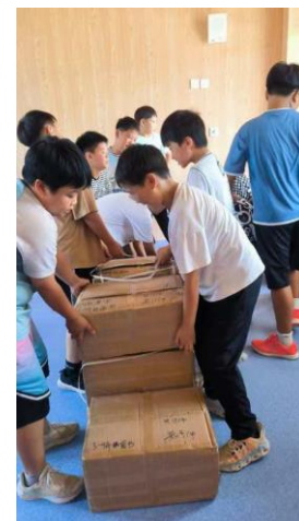
同学们协助打开图书包装