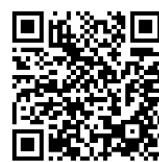
銀禧紀念特刊二維碼