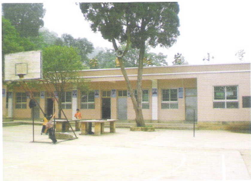
贵定县马场河乡红岩小学新教学楼照片