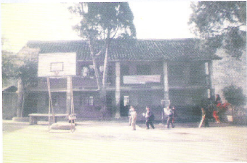
贵定县马场河乡红岩小学原教学楼照片

学校现有教师7人，学生157人，由于教学面貌的改善，教师的教学积极性得到极大提高，学生的学习氛围十分浓厚，教学质量不断提高。