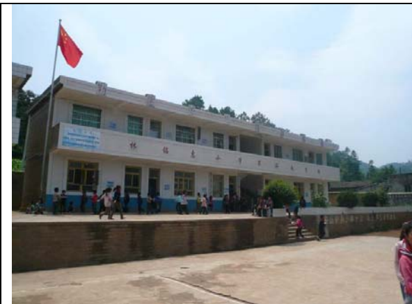
林銘惠小學第二教學樓