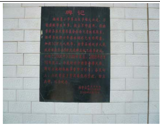
林銘惠小學第二教學樓碑記