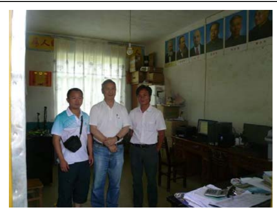
義工與校長(右)及教育局陪同(左)合照