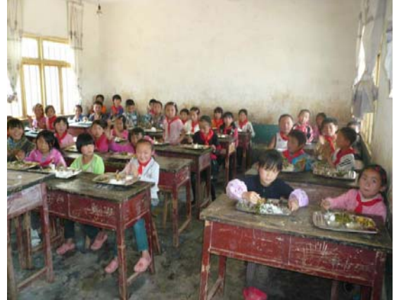
學生領了午餐回教室享用