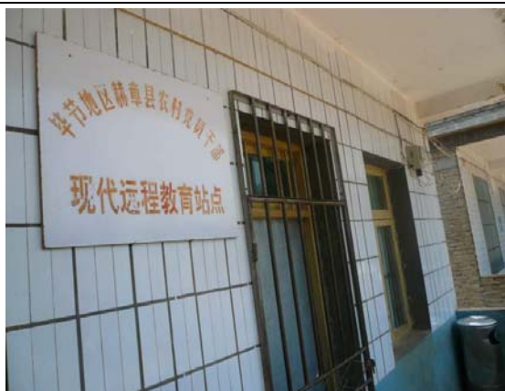
學校設有遠程教育教室