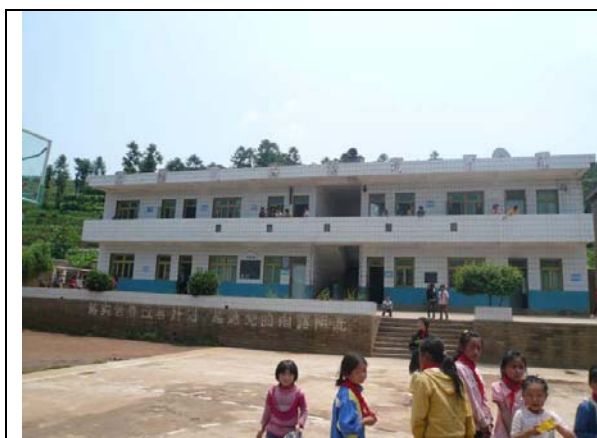
林銘惠小學教學樓