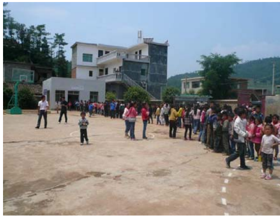
午飯時間，學生在籃球場排隊領取午餐