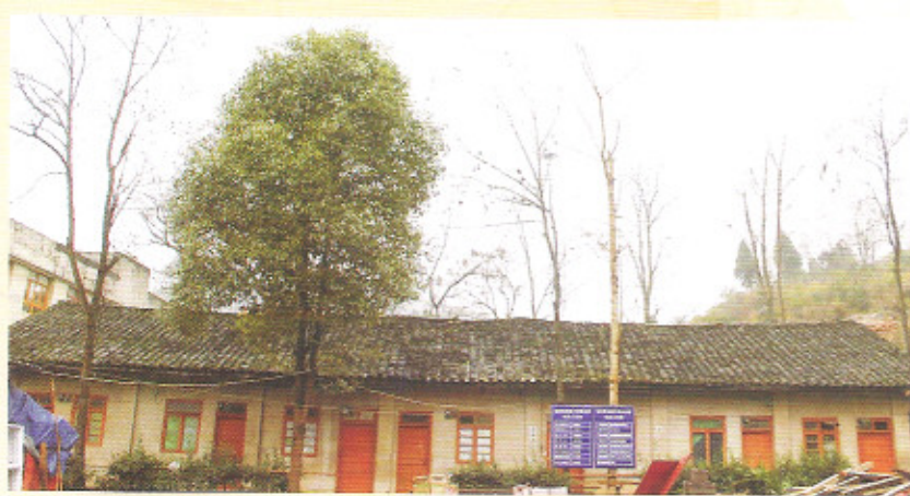
瓮安县珠藏镇珠藏中学慧明同心楼原址教室(建于70年代)