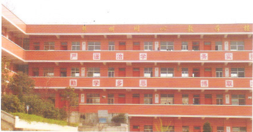
瓮安县珠藏镇珠藏中学慧明同心新教学楼