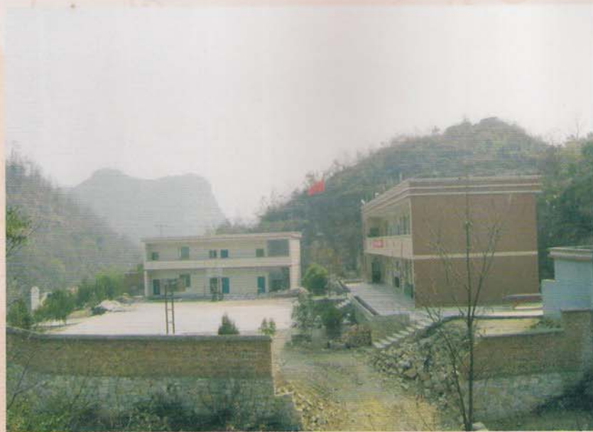
罗甸县董架乡东跃小平小学新教学楼