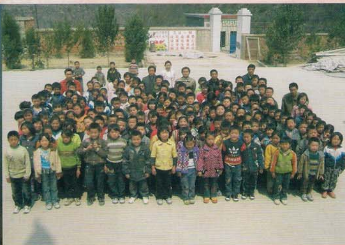
罗甸县董架乡东跃小平小学师生合影