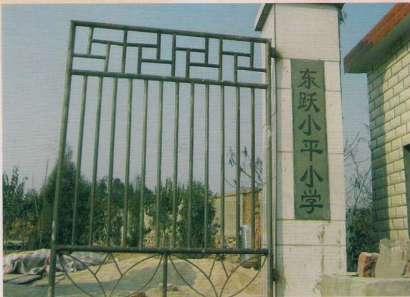
罗甸县董架乡东跃小平小学校门

迁址新建后，学校服务范围扩大，除原有的东跃村人口外，扩增田坝村和麻怀村的几个组，覆盖人口达3800人。由于改善了办学条件，优化了校园环境，拓宽了学生活动场地，生源增多了180多人。学校现开设一至六年级以及幼儿班共个7个班，在校生215人（其中：男生102人、女生113人）。