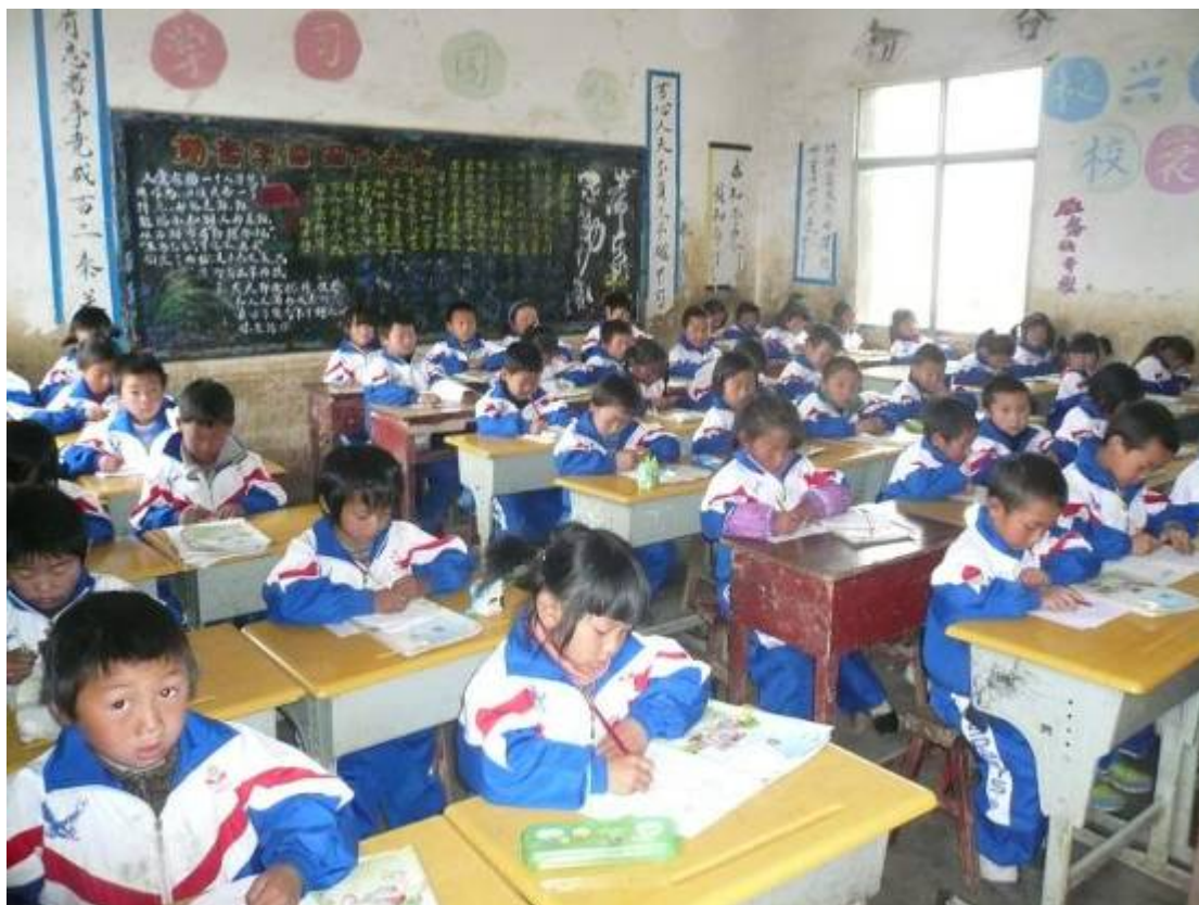
上下圖是其中兩個教室上課情況