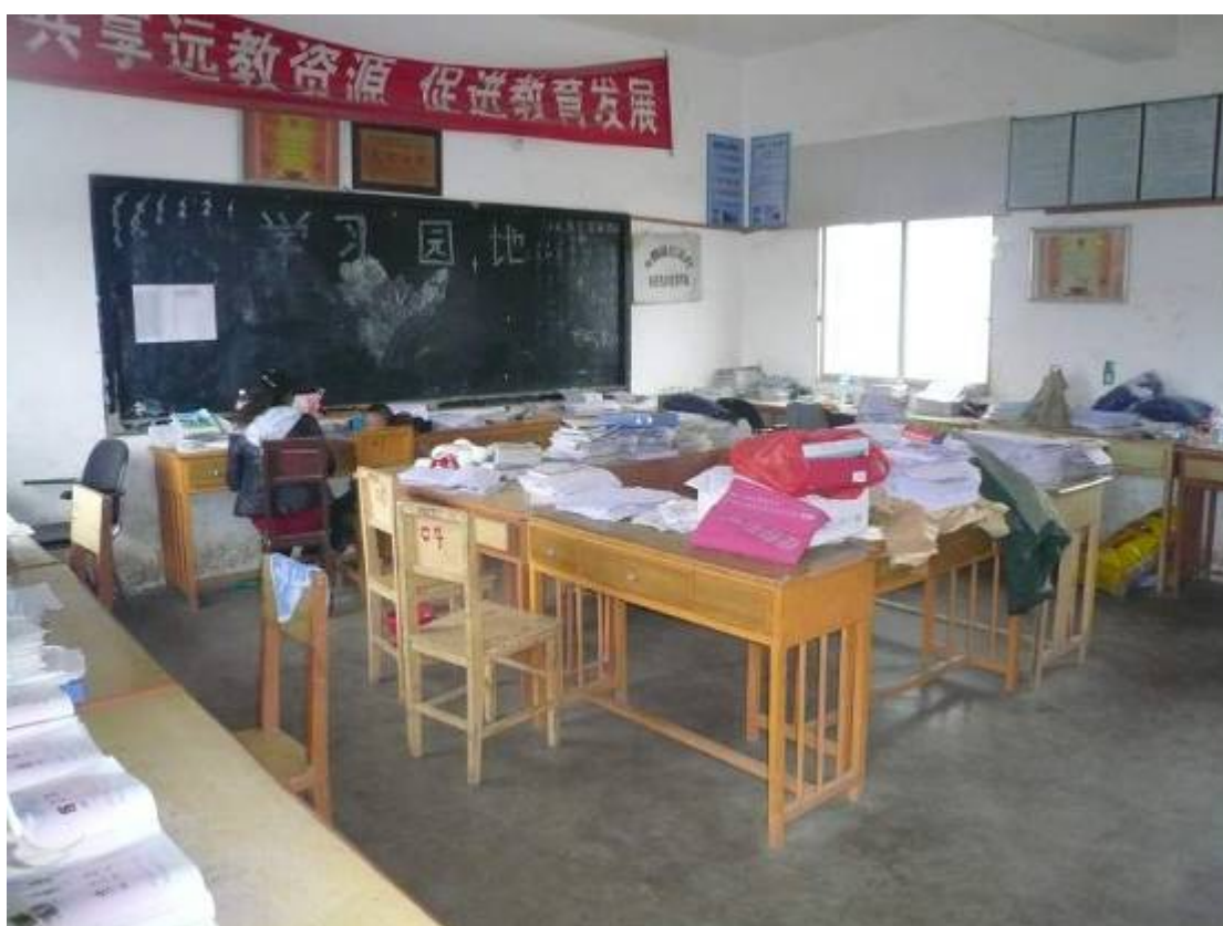
下圖：改爲辦公室之教室