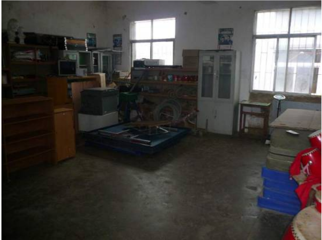
上圖：改爲儀器室之教室