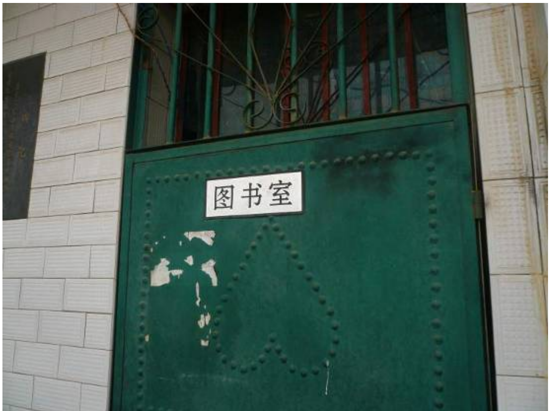
下圖：改爲圖書室之教室