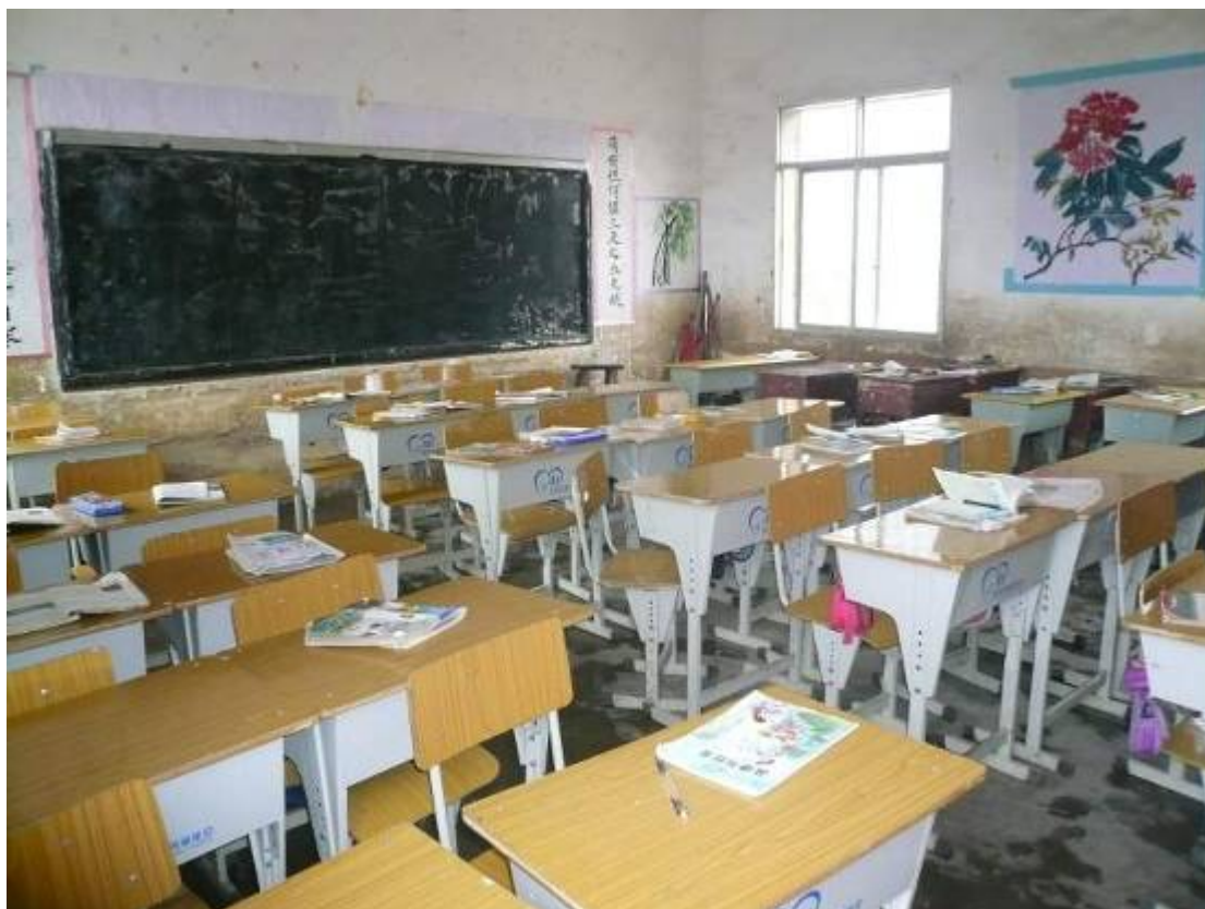
上圖：另外一個教室情況