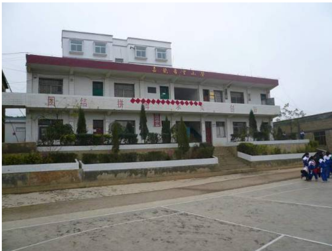
上圖：援建之教學樓