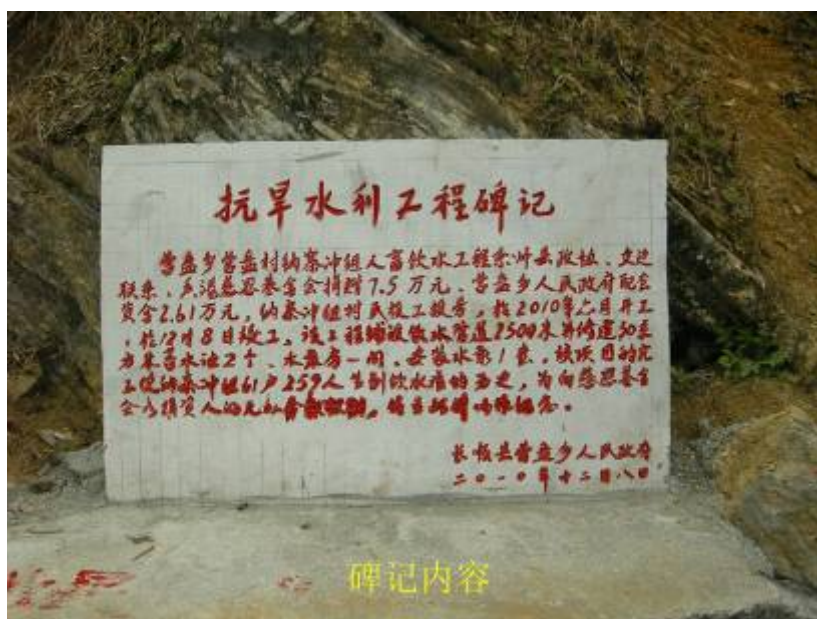
營盤鄉人民政府感謝慈恩基金會 援建引水工程的碑記