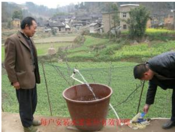
每戶安裝水龍頭有效管理