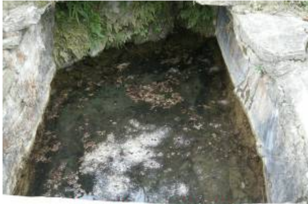
村民原飲用水，去年旱災時枯竭