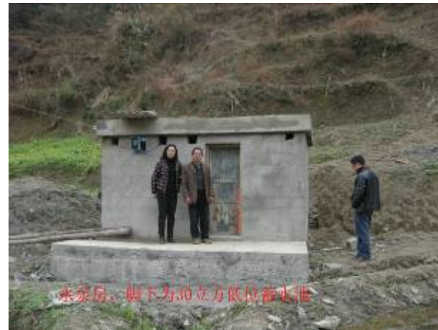
水泵房及低水位池