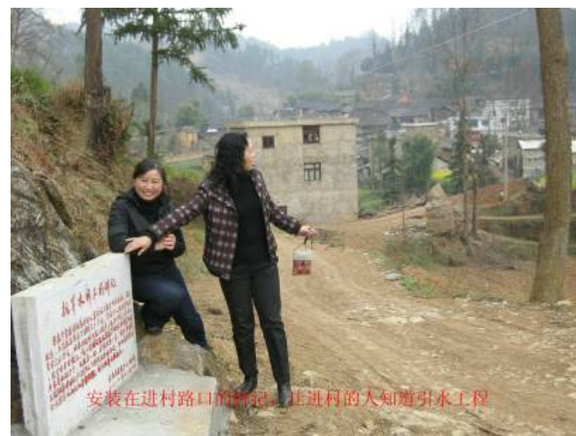
水源是在遠景的山上需用水管引水到村 村口擺放著項目的碑記