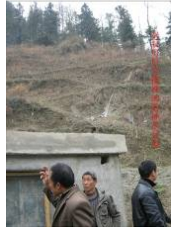
水泵房後可見到引水管道水從遠山傳來