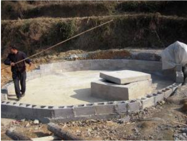
腊寨冲人饮工程高位水池外觀