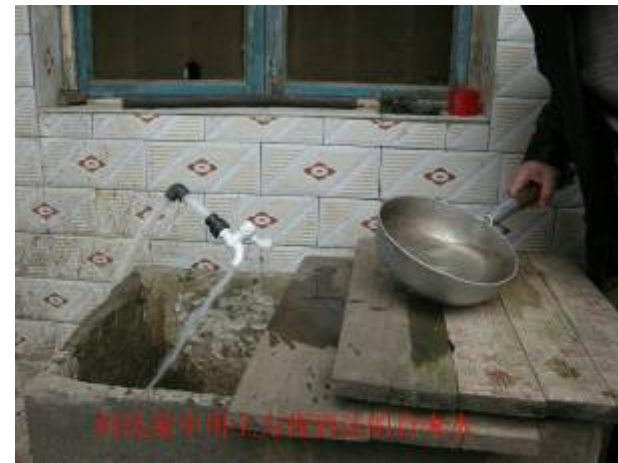
納寨寨中用上自來水淘米洗菜