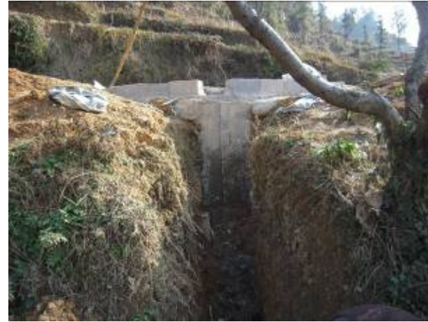
清水經埋藏的水管，流到山下的低位