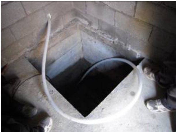
腊寨冲人飲工程蓄水池