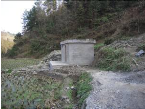
腊寨冲人飲工程管理用房全景