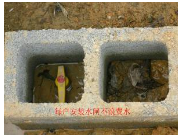
每戶安裝水閘節省用水