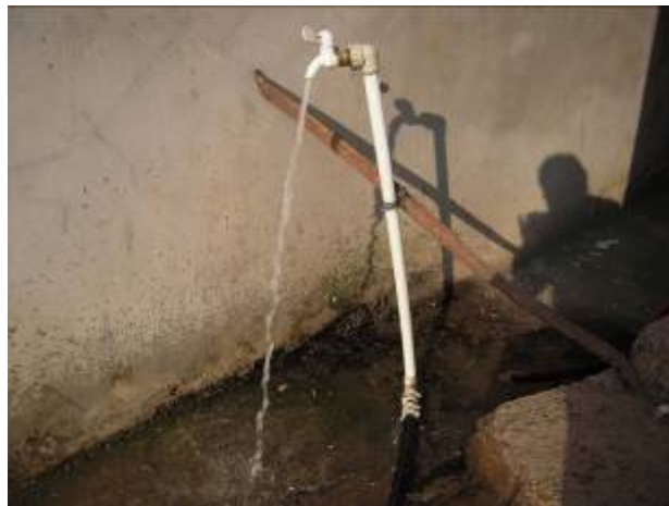
水已到户的腊寨冲人飲工程