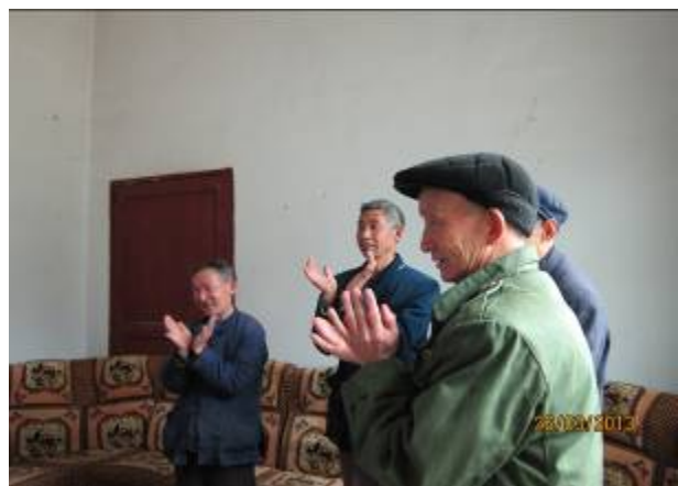
齊齊做健康手部操