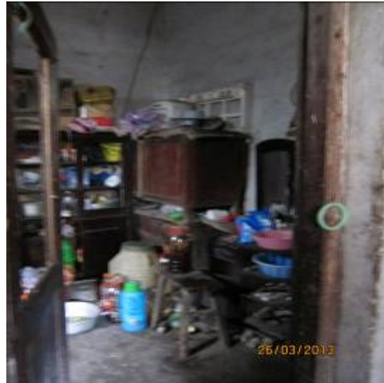
老人家因腰痛無法清潔家居故較凌亂