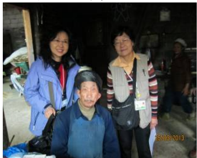
老人家與義工合照