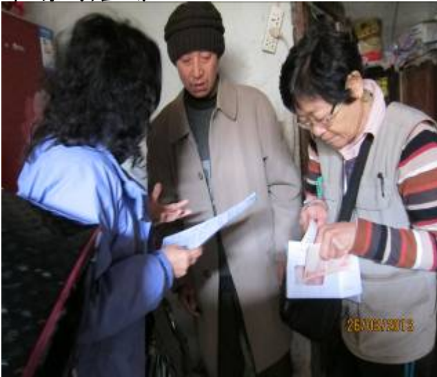
義工送上香港義工編的帽子及敬老金