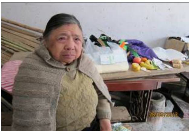
老人家見到義工探訪激動落淚