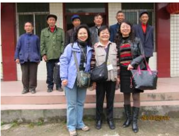
義工與統戰部官員及長者合照