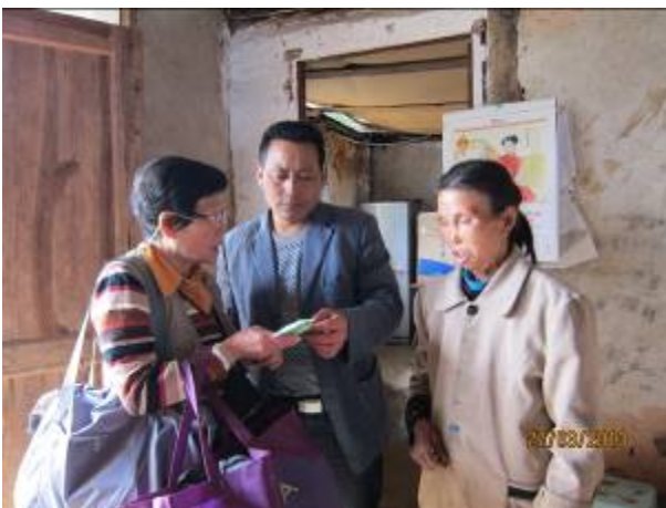
請聯絡人教她如何用藥油