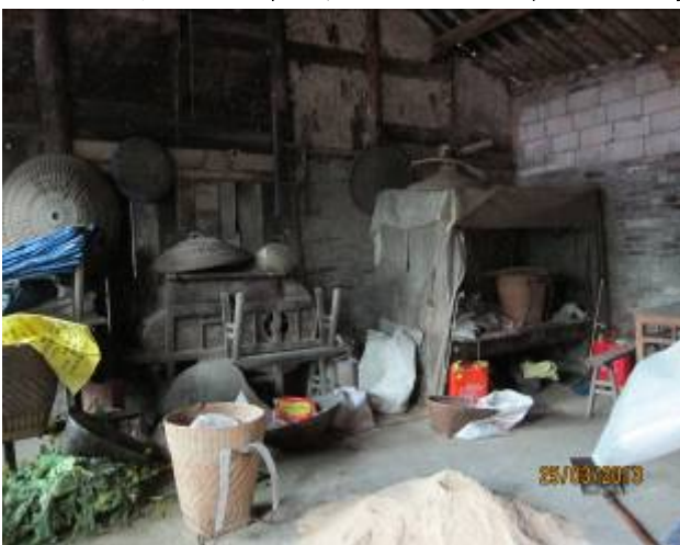
老人居室簡陋尚整潔