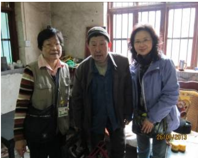
義工送上敬老金後合照