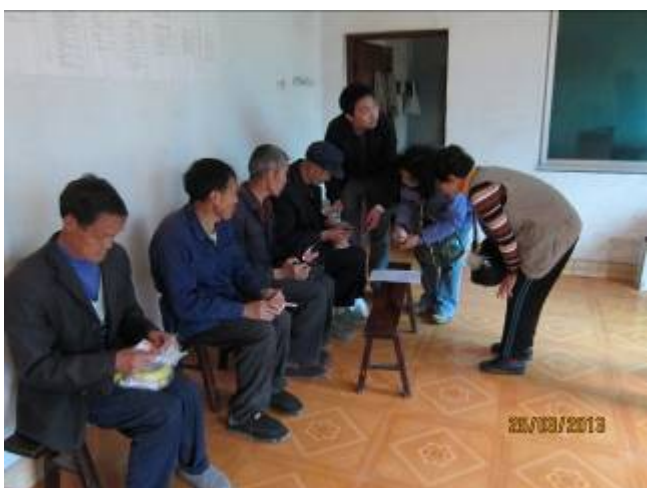
向住院老人家送上敬老金