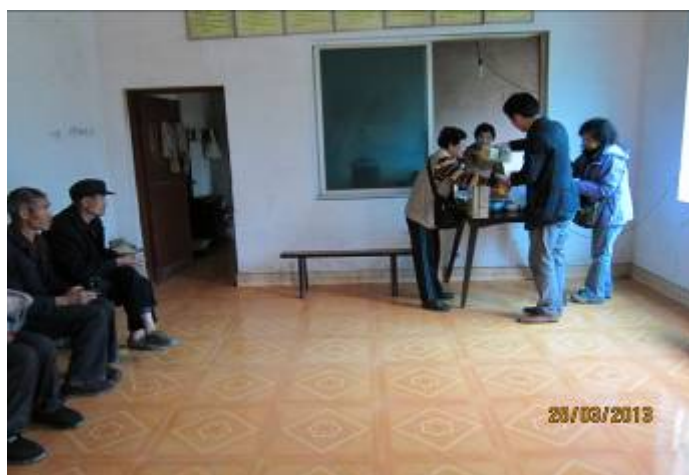
義工送上麵條,牛奶,糕餅等