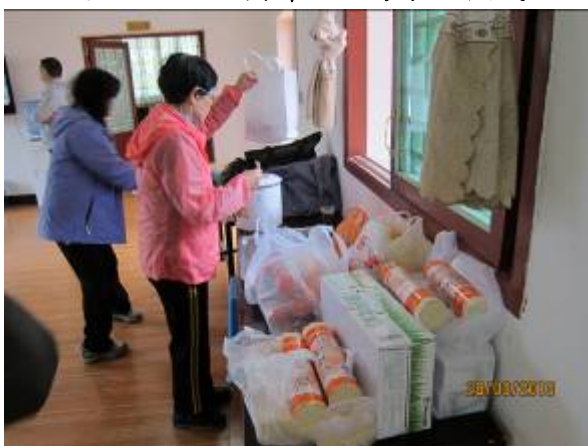
拿禮物準備送給長者