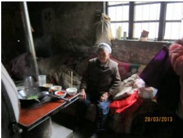
探訪時，老人正在吃飯