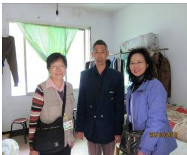
老人家的房間打掃整潔