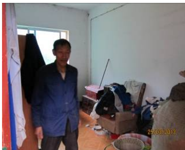
住院老人家各自有獨立房間