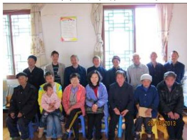
義工與部分長者合照