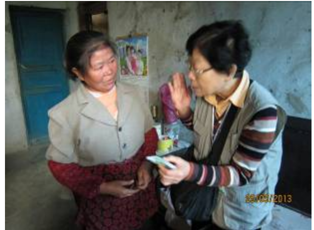
義工解釋如何使用藥膏