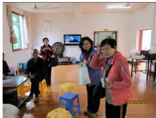
告訴長者藥膏的用途