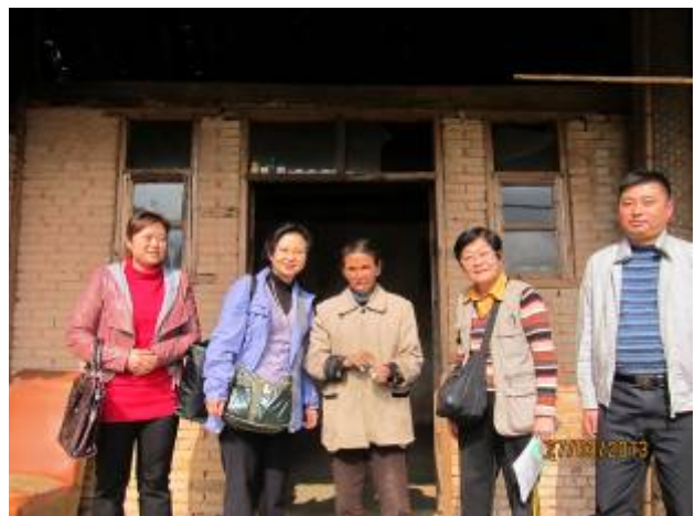
與民政辦官員合照