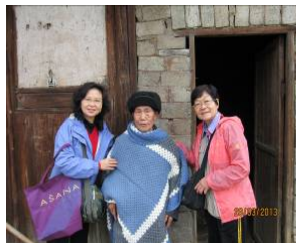
老人披上禮物與義工合照