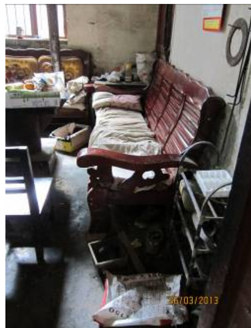
老人家的家居環境