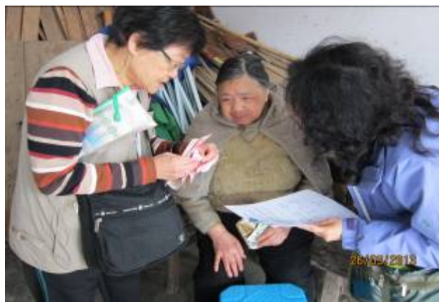
義工安慰老人家並送上敬老金