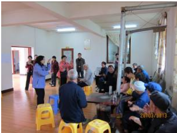
義工教長者做手操

他們的起居飲食都得到妥善照顧，能自理的可幫上一把。最老的一位 89 歲，健康樂觀，還會招呼客人呢！