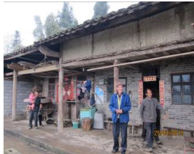
老人家向大家道別