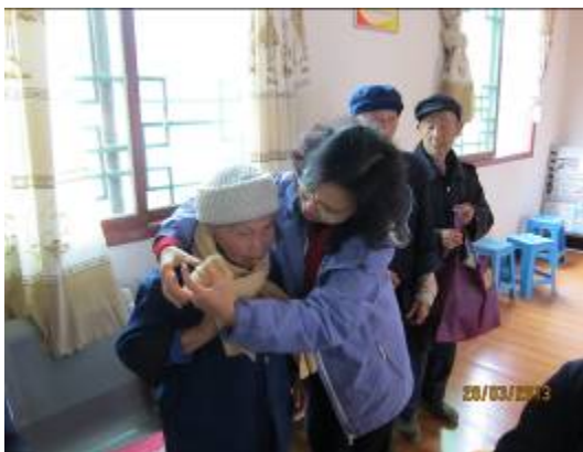
送上毛編頸巾並為長者戴上