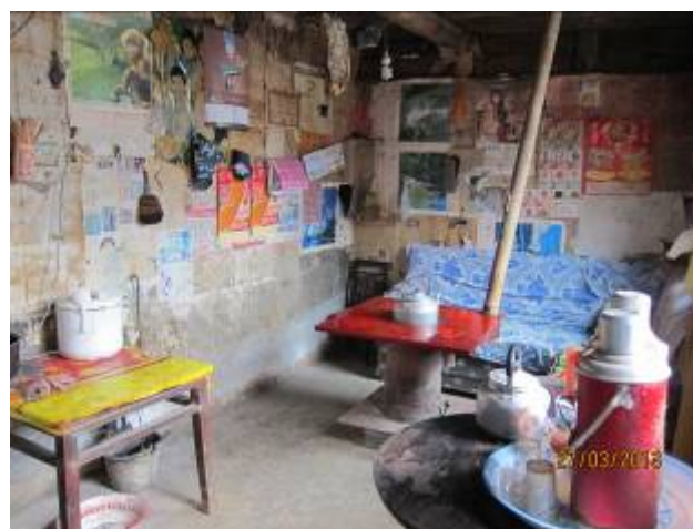
居室雖簡陋，卻感其性格樂觀