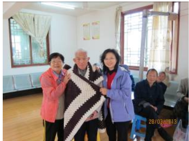
送手鉤毛毯給最老的長者