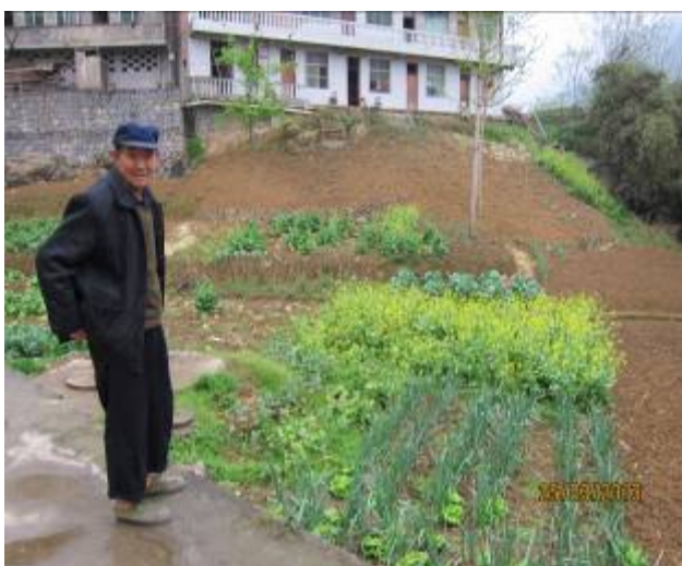
住院老人家自己種菜,自給自足