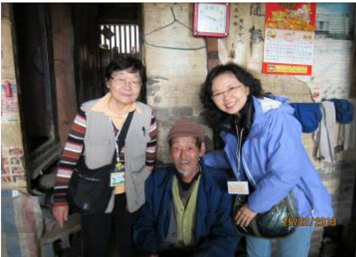
老人家收到敬老金後開心地與義工合照