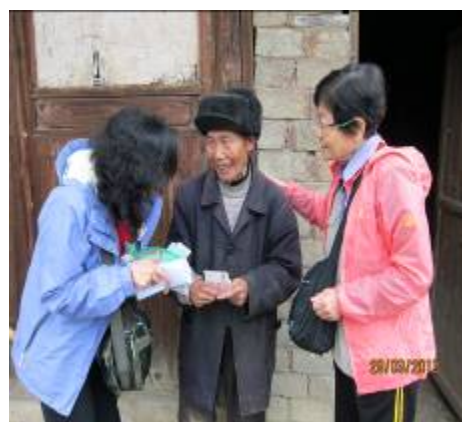
義工送上敬老金及禮物